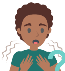
Faigata le mānava