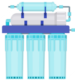
Bajo el Fregadero

Ejemplos de cómo son los diferentes modelos de filtros: