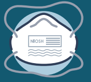
적합성 테스트를 거친 N95 호흡보호구

*필요한 개인 보호 장비는 필수 격리 예방조치에 따라 상이합니다. 예방 조치 수준에 맞게 개인 보호 장비 및 단계 순서를 변경하십시오.