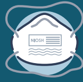
적합성 테스트를 거친 N95 호흡보호구