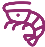
Động vật có vỏ giáp xác