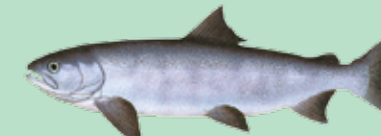
Chum (Dog, Keta)